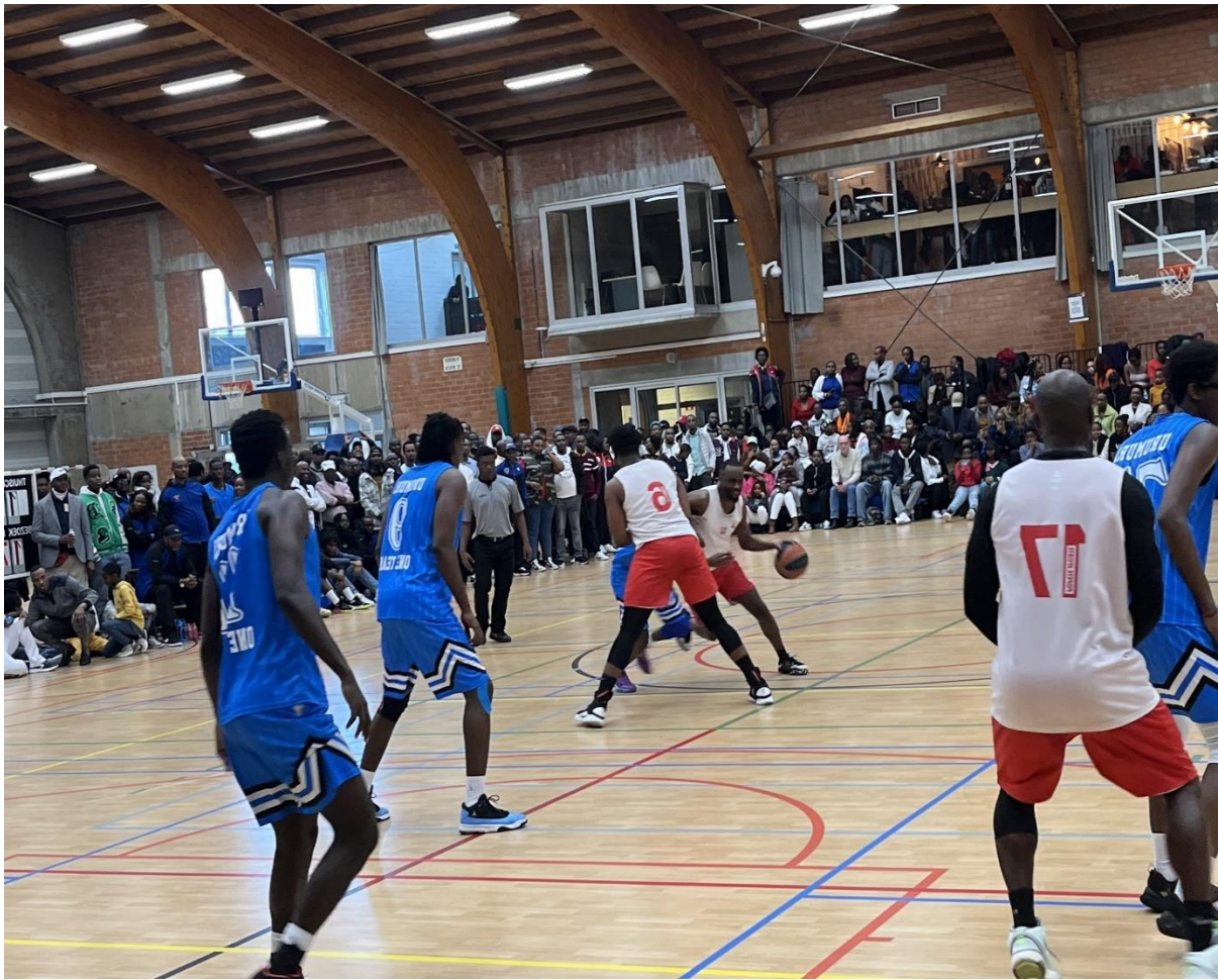
En bleu-blanc c'était « URUMURI ONE TEAM » et « Rouge-blanc c'était « Amicale Liège »

Après un long combat de jeux très musculeux entre les deux équipes, c'est finalement l'équipe « Amicale Liège » qui a gagné la finale. Et c'est la quatrième fois que cette équipe de basket-ball de la diaspora burundaise vivant dans la Province Liège (Belgique) remporte une telle victoire dans un tel tournoi.