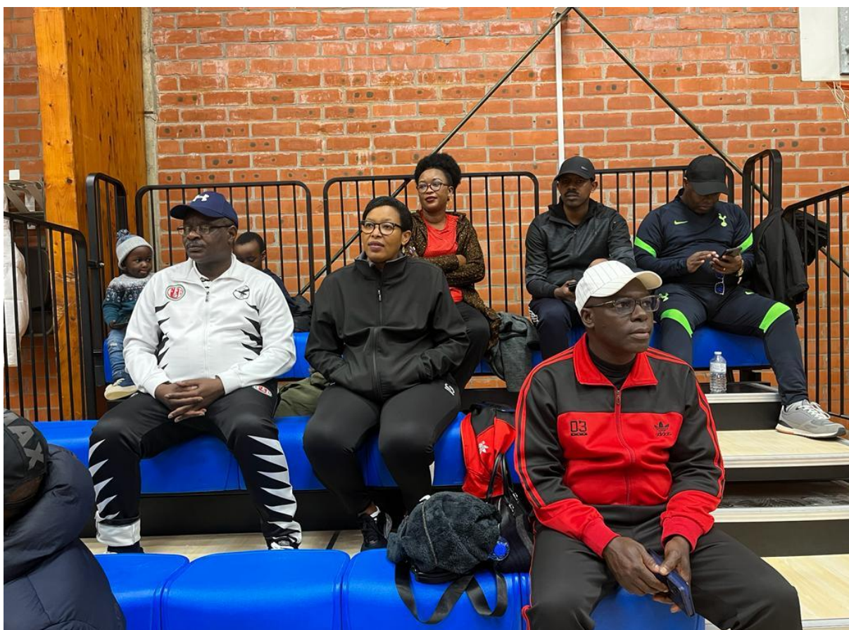
Photo de la délégation de l'Ambassade au stade