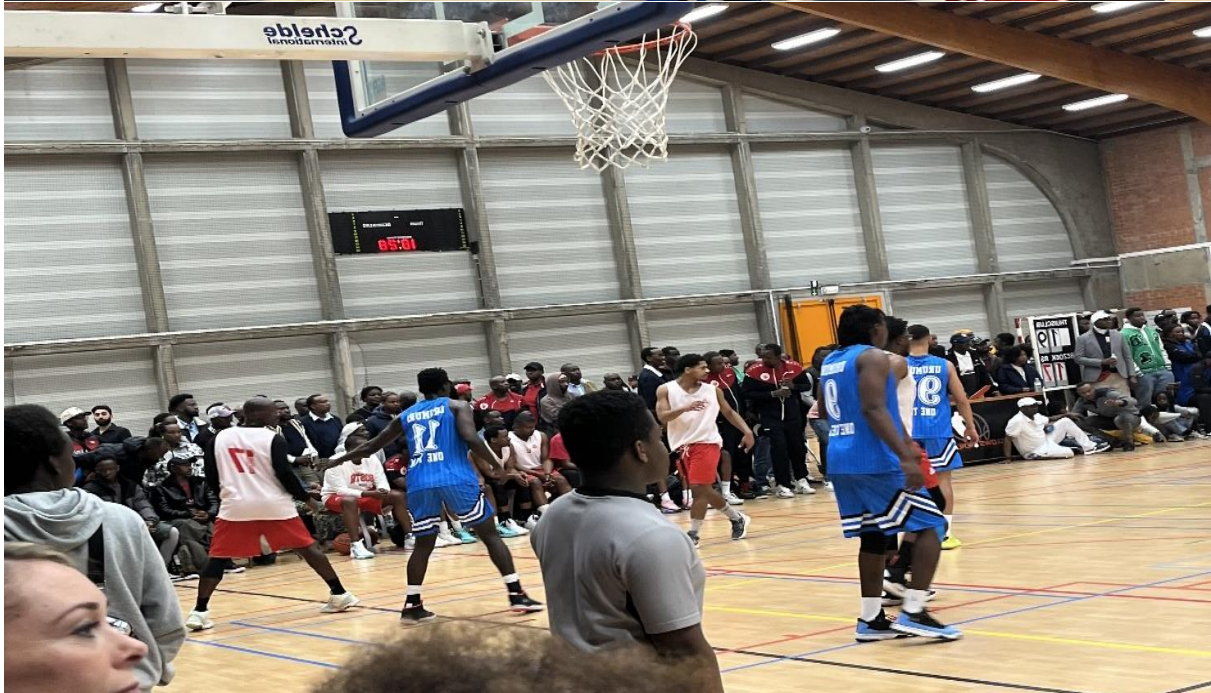
En bleu-blanc c'était « URUMURI ONE TEAM » et « Rouge-blanc c'était « Amicale Liège »