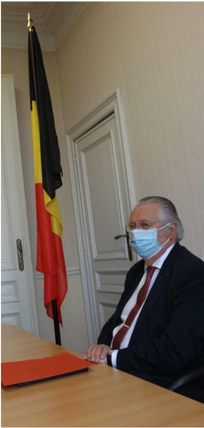
Au Secrétariat général de l'OEACP