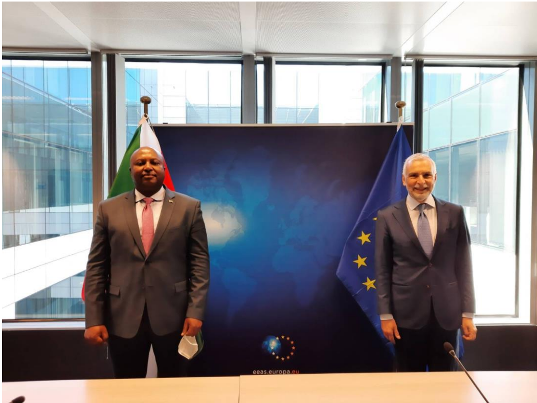
Le Ministre Albert SHINGIRO avec le Ministre d'Etat et Député fédéral belge, Mr André FLAHAUT