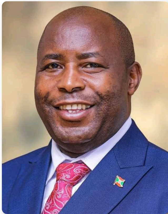
Nyenicubahiro Evariste Ndayishimiye