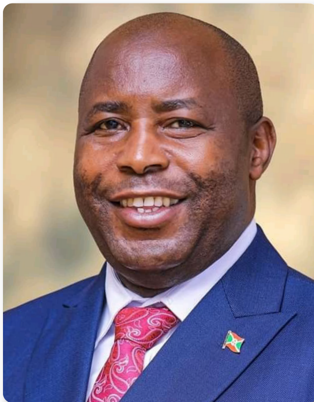
Son Excellence Evariste Ndayishimiye