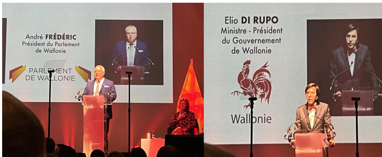
Hon André FREDERIC

11. La 4 ème étape, donc au niveau du Parlement de Wallonie, les cérémonies se sont déroulées en deux étapes à savoir la Présentation des discours de circonstance respectivement par l'Honorable André FREDERIC, Président du Parlement de Wallonie, SE Elio DI RUPO, Ministre-Président du Gouvernement de Wallonie et S.E Mme Malu DREYER, Ministre-Présidente du Gouvernement de Rhénanie-Palatinat, un des Etats fédéraux de l'Allemagne. C'était au palais des congrès du Parlement wallon.