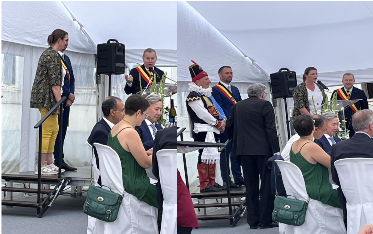
Le Gouverneur de la Province de Namur en train de prononcer son discours